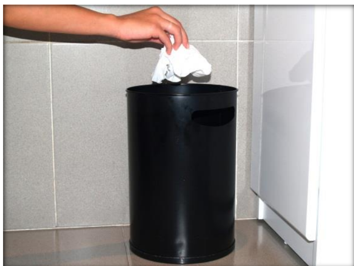
Tira la toalla a la basura