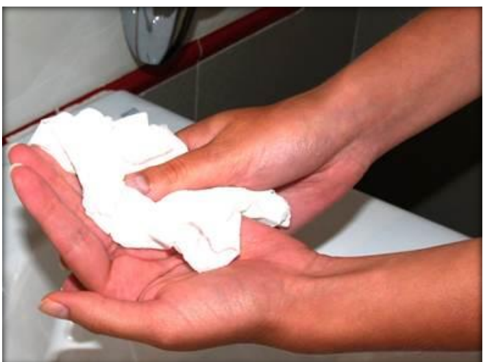
Sécate las manos con una toalla desechable