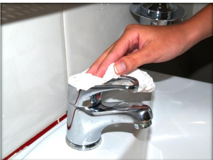
Usa la misma toalla para limpiar el grifo