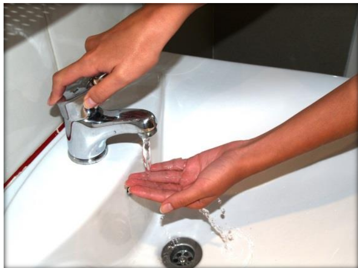
Mójate las manos

Sigue estos pasos durante el lavado de manos