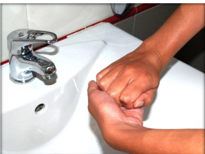
Frótate los dedos de una mano con la palma de la opuesta