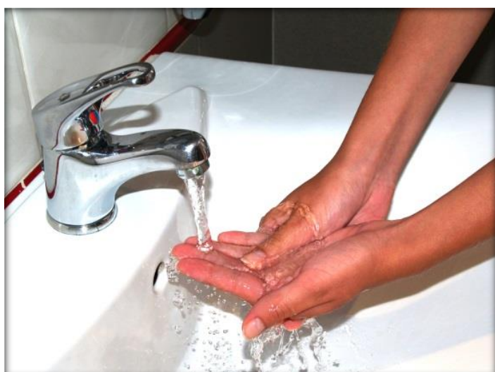
Enjuágate las manos con agua