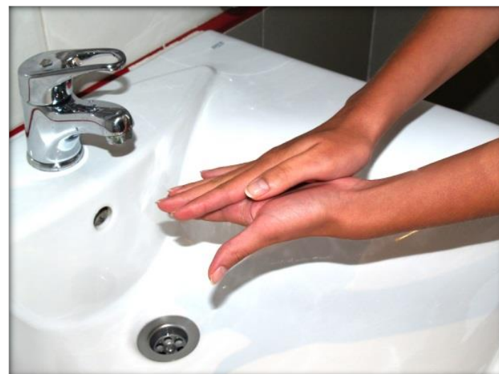
Frótate las palmas de las manos