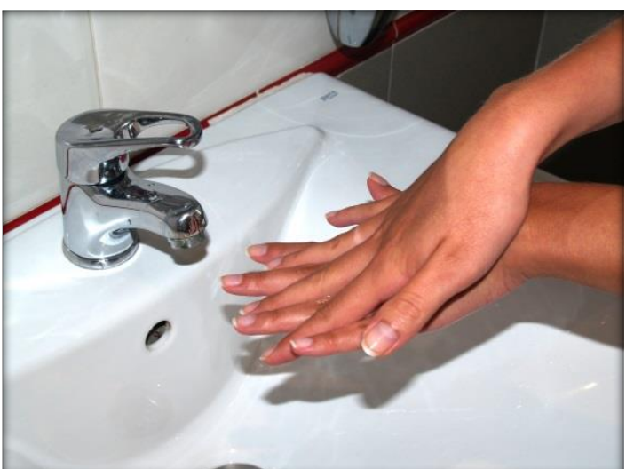
Frótate las palmas con los dedos entrelazados